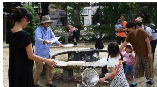
9月24日開催の「シャボン玉遊び」

親は、「ディスカッション」と「子どもと一緒に遊ぶ」グループに分かれ、お互いに子育て体験をします。他人の子どもたちを見守り遊ぶことで、自分の子育てをみつめ直します。