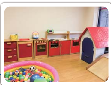
名古屋市地域子育て支援拠点「遊モア」

子どもたちが遊べるだけでなく、保護者も友達を作ったり、近所の情報を手に入れたり、不安を話したりしてホッとする場です。遊び・出会い・つながる場がある事で日々頑張っている親子をサポートします。