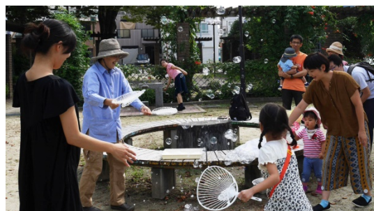
9月24日開催の「シャボン玉遊び」

親は、「ディスカッション」と「子どもと一緒に遊ぶ」グループに分かれ、お互いに子育て体験をします。他人の子どもたちを見守り遊ぶことで、自分の子育てをみつめ直します。