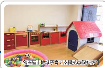
名古屋市地域子育て支援拠点「遊モア」